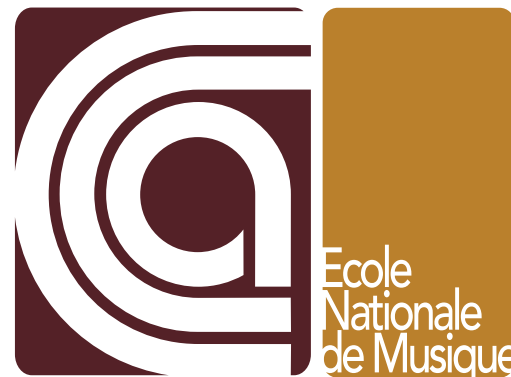
Ecole Nationale de Musique Ecole nationale de musique Centre Culturel Aragon Oyonnax